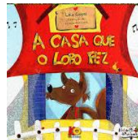
A casa que o Lobo fez Autora – Léia Cassol (Primeiro semestre)